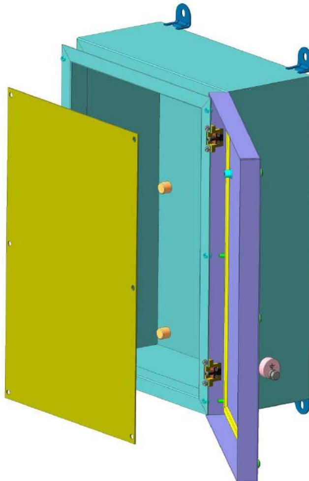
Рисунок 4.2 – Конструкция КВУ-10 с крышкой на петлях

Исполнения КВУ-10 с крышкой на петлях обеспечивают открытие крышки на 120° относительно корпуса. Внутри корпуса установлена монтажная панель, которая крепится винтами в резьбовые втулки, герметично вваренные в дно корпуса.